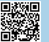
▲タグラインページ

本タグラインの詳細は、QRコードよりご確認ください。 https://okadaaiyon.com/bluepride 《PR戦略室》