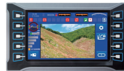
標準装備の7inchモニター